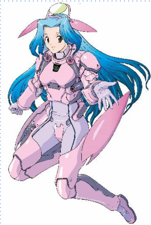
志木市観光PRキャラクター いろは水輝 © 志木市（松浦まさふみ画）