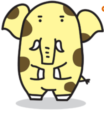
新座市のイメージ キャラクター 「ソウキリン」