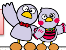
埼玉県のマスコット 「コバトン&さいたまっち」