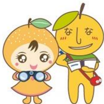
白岡市マスコットキャラクター 「なしりん・なしべえ」