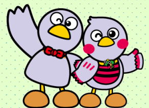
埼玉県のマスコット 「コバトン&さいたまっち」