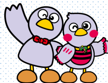
埼玉県マスコット 「コバトン&さいたまっち」