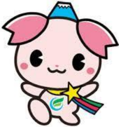
ふじみ野市マスコットキャラクター 「ふじみん」