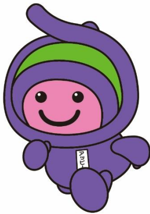
上尾市マスコットキャラクター 「アッピー」