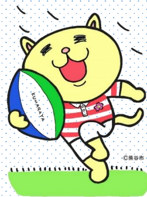
熊谷市マスコットキャラクター 「ニャオざね」